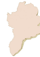
Vilalba del Arcs D.O. Terra Alta Viticultura de Secano Sostenible