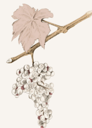
Garnacha Negra Syrah

Vino joven con mucha fruta, aromas primarios que denotan la ternura del que es nuevo pero con una buena corpulencia al paso por boca