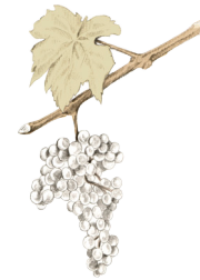
Garnacha Blanca Macabeo

Vino joven con mucha fruta, aromas primarios que denotan la ternura del que es nuevo pero con una buena corpulencia al paso por boca